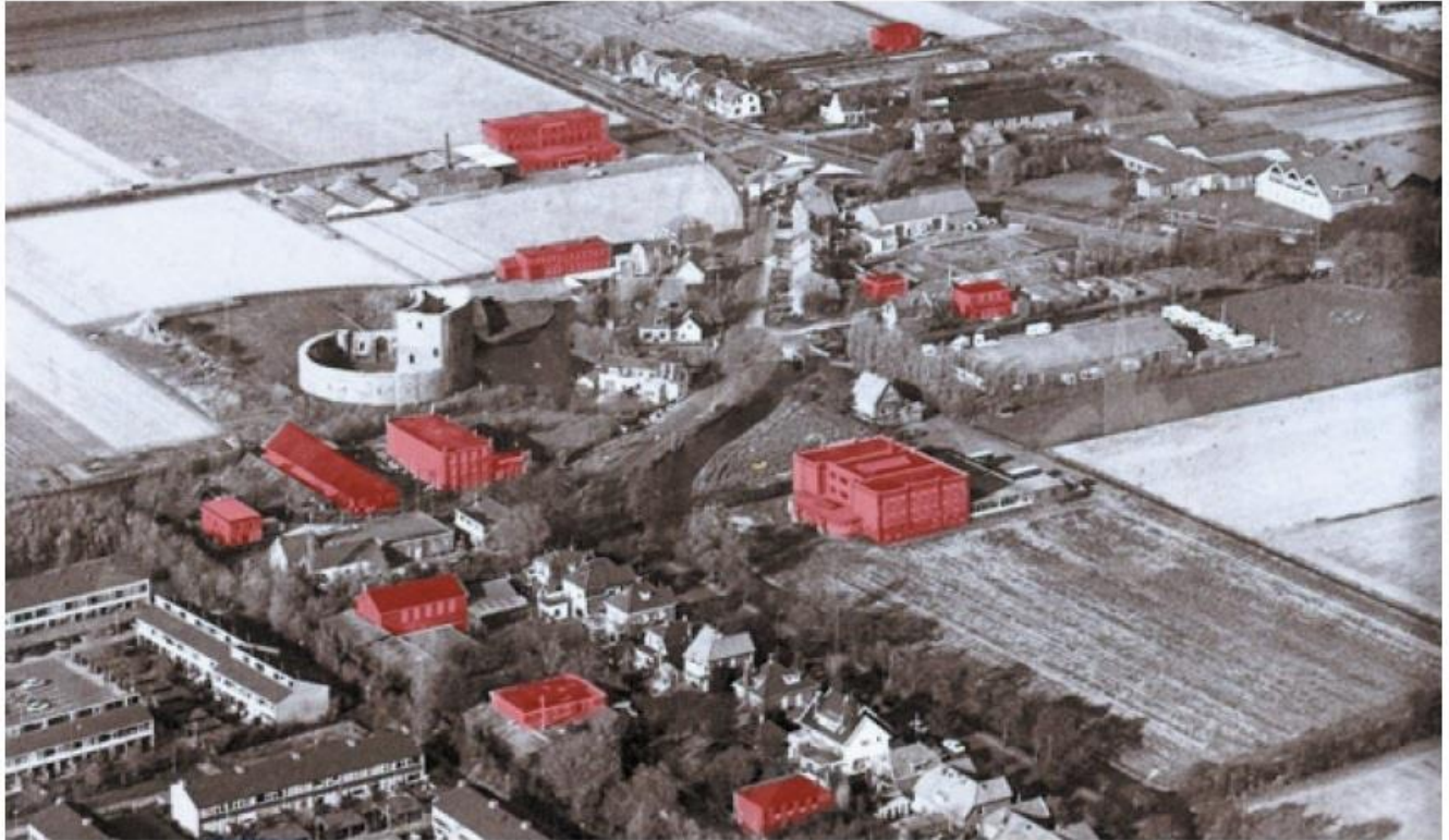
circa 1975 - luchtfoto met de bollenschuren (in rood) in hun oorspronkelijke context