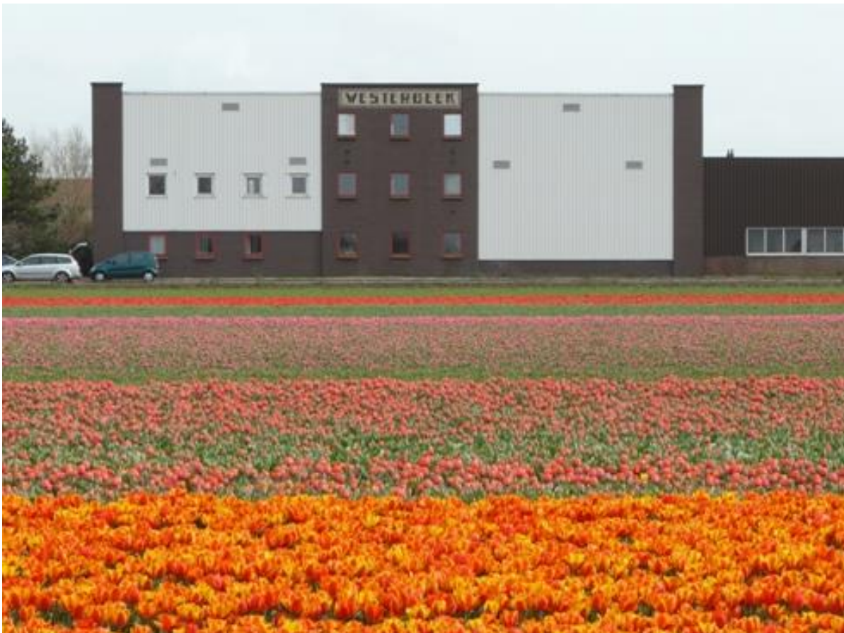
Foto 4: De bollenschuur van Westerbeek als bollenburcht te midden van de bollenvelden. Bij restauratie kunnen de authentieke kenmerken van de bollenschuur hersteld worden.