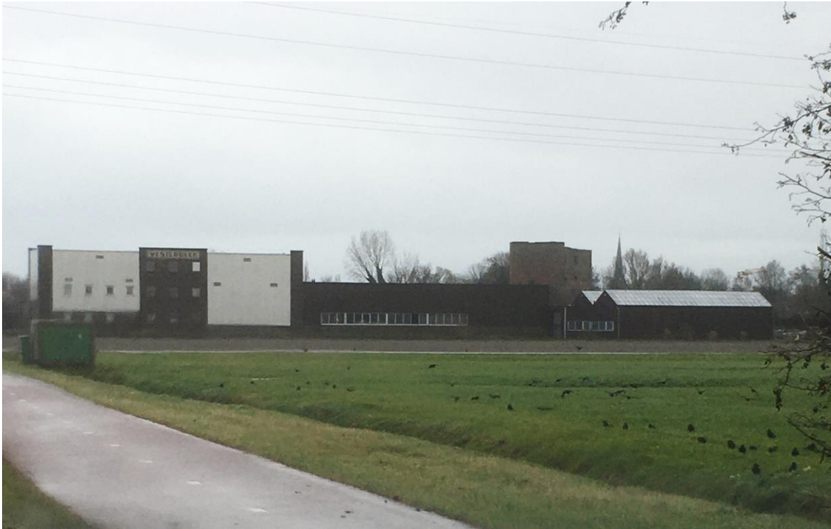
Foto 3: Zicht op de Ruïne van Teylingen vanaf de Teylingerlaan. Het zicht wordt niet belemmerd door de oude bollenschuur uit 1930, maar alleen door de latere aanbouwen.